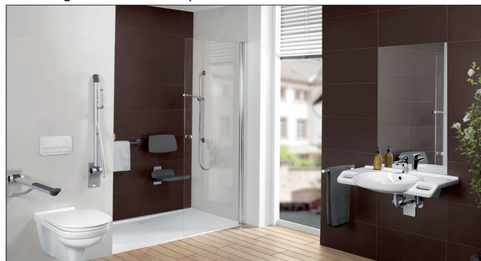
txn. Barrierefreiheit im Bad bietet ein Plus an Sicherheit und Komfort, das auch jüngere Menschen zu schätzen wissen. Wichtig: Schon in der Planungsphase sollte ein SHK-Fachbetrieb hinzugezogen werden, damit das Bad im Alter möglichst lange genutzt werden kann.

aus dem SHK-Fachbetrieb vor Ort kennen die gesetzlichen Vorgaben und helfen dabei, individuelle Wünsche zukunftssicher umzusetzen. Das beginnt bereits bei der Wand, die stabil genug sein muss, um später einen Duschsitz anzubringen, und hört bei der intelligent geplanten Leerverrohrung zum Nachrüsten von Nachlicht oder Notruf-Schalter nicht auf. Auch unterfahrbare Waschbecken, eine bodenebene Duschfläche, rutschhemmende Bodenbeläge, Bewegungsmelder, ein durchdachtes Beleuchtungskonzept und vieles mehr sind zu berücksichtigen. Der SHK-Profi kennt alle geeigneten Produkte und kann deswegen ein zukunftssicheres Bad realisieren, das bis ins hohe Alter bequem und sicher zu nutzen ist.