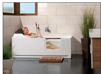
txn. Eine altersgerechte Badewanne bietet jungen Menschen Komfort und gibt Senioren Sicherheit. Bei Planung und Montage hilft der SHK-Fachbetrieb.

txn. Moderne Generationenbäder müssen sorgfältig geplant werden. Denn schließlich gilt es, grundverschiedene Bedürfnisse zu erfüllen. Während es jungen Familien meist um Design und